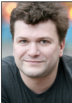
Metteur en scène