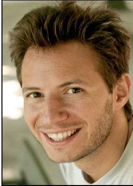
François 1 er